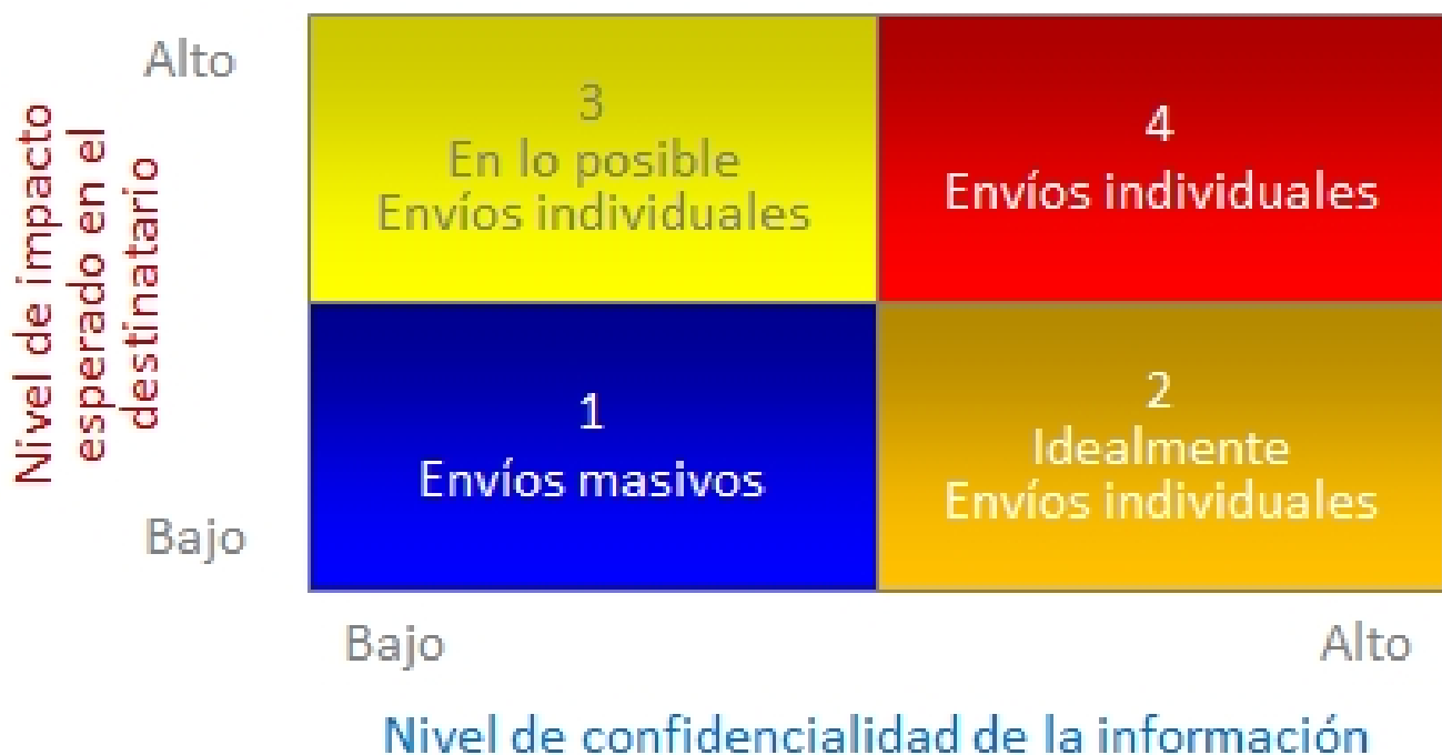
Figura 1. Matriz de Decisión de Envío de Correos a Grupos de Destinatarios

Llevo ya algunos años analizando las características de los envíos grupales, habiendo interactuado con profesionales de distintos rubros, en varios países y creo que son dos los factores principales que determinan si un envío debe ser masivo o individual: el nivel de confidencialidad de la información y el nivel de impacto esperado en el destinatario.